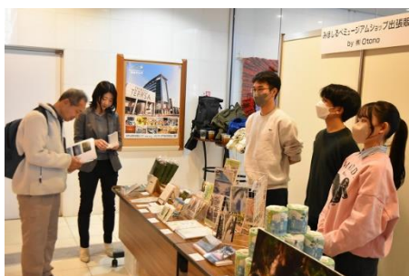
みほしるべミュージアムショップの出張販売