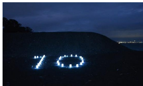
土を運んだ容器を利用した キャンドルナイト