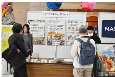
パネル展示の様子

(一社)三保松原3ringsプロジェクト、(株)gosea's、静岡市三保松原文化創造センター「みほしるべ」など計11団体が三保松原に関する取組等についてパネル展示を行いました。また、みほしるべミュージアムショップの出張販売、新ご当地グルメ「三保バーガー」の販売を行いました。