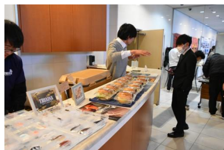
三保バーガーの販売