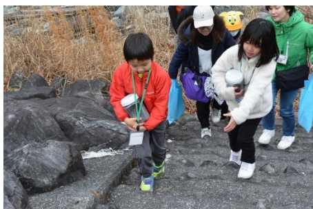
土を運んでいる様子

当日は、小学生11人と保護者9人の合わせて 20人 が参加し、安倍川の砂防事業や清水海岸の侵食対策について学びました。