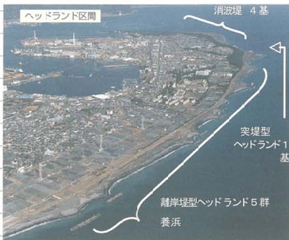
ヘッドランド区間

清水海岸の三保地区では、高潮による被害を未然に防ぐために砂浜の幅を確保する目的で、平成元年からヘッドランドと養浜の組み合わせによる高潮対策事業が行なわれています。ヘッドランド工法とは、岬と岬の間に挟まれた砂浜が安定していることにヒントを得た工法です。