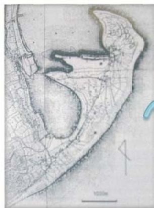
明治20年の三保半島