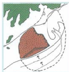
海流による有度山の侵食