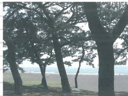
三保の松原の風景