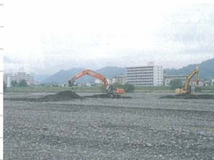
安倍川での砂利採取

養浜事業の実施にあたっては、良質な養浜材を継続的に確保するために、安倍川の堆積土を養浜材として使用することで安定した供給をしています。安倍川については、海岸侵食の発生の原因ともなっていた砂利採取を禁止して以降、逆に川底が上昇し、治水安全上問題が生じた区域もあり、流れを妨げる箇所について砂利採取を行い、養浜材として利用しています。